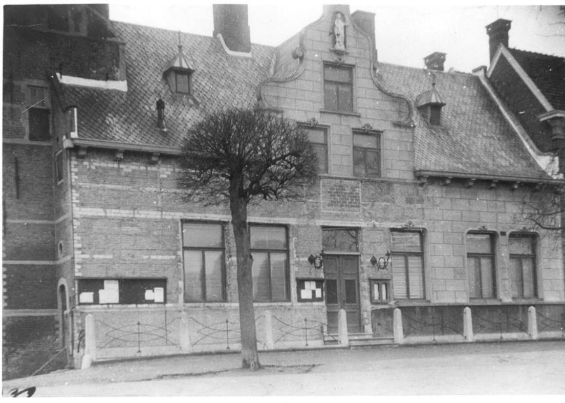
Het raadhuis met links de van de cementlaag ontdane gevel die rechts nog gedeeltelijk bepleisterd en geblokt is