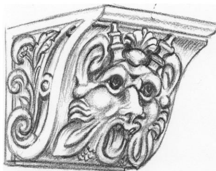
Ontwerpen voor consoles onder de zolderbalken van de secretarie