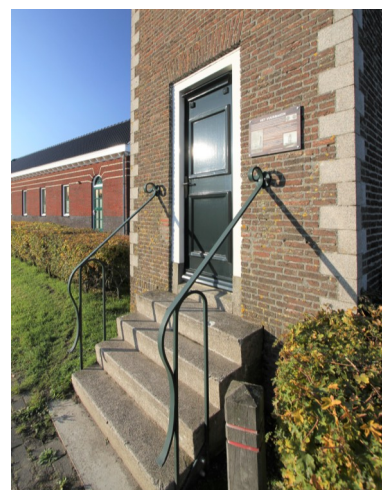
De smeedijzeren trapleuningen zijn in 2010 aangebracht.