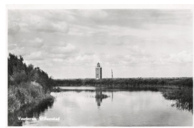
De vuurtoren omstreeks 1953.