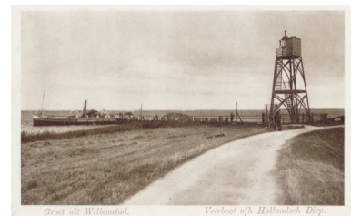
De lichtopstand van Willemstad en de stoombootsteiger omstreeks 1925.