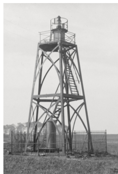
Het lichthuis is verdwenen en vervangen door een lantaarn met gaslicht. Vermoedelijk eind jaren 1920.