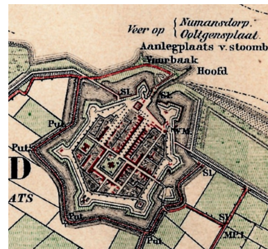
Topografische kaart van Willemstad uit 1870, met daarop de stoombootsteiger en de vuurbaak.

Het object is nog in goede staat en zeer herkenbaar. In de loop der jaren is er weinig aan veranderd en aanpassingen en onderhoudswerk zijn steeds gedaan met respect voor het ontwerp. Oorspronkelijk hadden de daglichtopeningen in de schacht ramen, maar die zijn al in de jaren vijftig verwijderd en de openingen zijn, naar binnen toe verspringend, dichtgemetseld met dezelfde baksteen als van de schacht. In 2010 is de vuurtoren gerestaureerd, waarbij onder meer de oorspronkelijke metalen balustrade rond het lichthuis om veiligheidsredenen werd verhoogd door er een geleding onder te bevestigen. Het uiterlijk is niet wezenlijk veranderd. De huidige smeedijzeren trapleuningen bij de ingang zijn tijdens deze restauratie aangebracht. De originele metalen trapleuningen, bevestigd aan betonnen paaltjes, werden decennia geleden verwijderd.