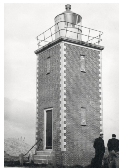
De vuurtoren omstreeks 1965.