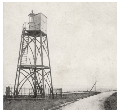
De gietijzeren lichtopstand van Willemstad in 1911.