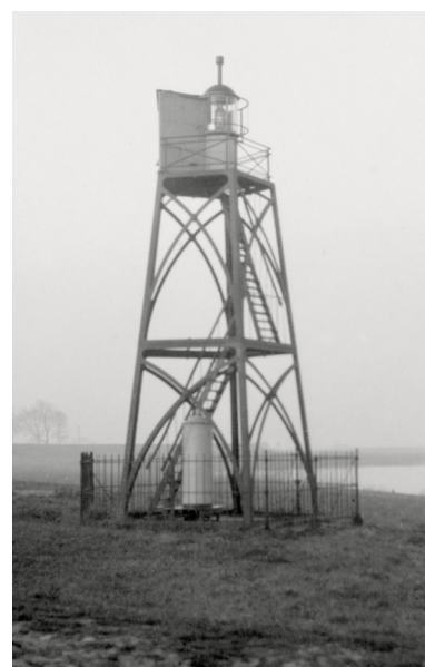
In het lichthuis van de lichtopstand is een gasgloeilicht geplaatst, herkenbaar aan het pijpje op de koepel. De foto dateert vermoedelijk van omstreeks 1925.

Tijdens de Franse Tijd (1794-1814) viel het scheepvaartverkeer vrijwel stil maar daarna leefde dit weer flink op. Toen begonnen er klachten te komen over de verlichting van het baken van Willemstad. De twee kleine lantaarnlampjes zonder lichtkaatser waren onvoldoende zichtbaar. In 1816 gaf de Gouverneur der Provincie daarom opdracht om vier Engelse lamplichten te plaatsen, gericht naar de diverse vaarrichtingen. De klachten werden echter niet minder. Daarom werd er in 1820 een nieuwe lantaarn gebouwd, in opdracht van kapitein-ter-zee Twent van het Loodswezen. Deze lichtopstand werd daarna nog enkele malen vernieuwd. In 1868 werd de lichtopstand opnieuw vervangen, dit keer door een vijfhoekig gietijzeren vuurtorentje; een constructie die maar weinig is toegepast bij vuurtorens in Nederland. In 1923 werd het vaste licht van deze toren veranderd in een onderbroken licht. Mogelijk werd toen ook een gasgloeilicht geplaatst, maar dat werd al in 1930 vervangen door een elektrisch licht. In maart