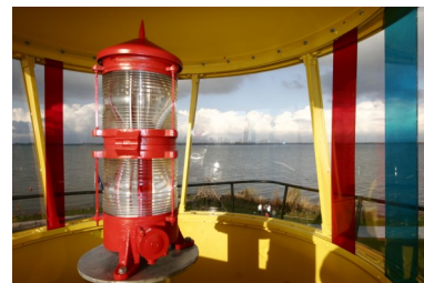
Het lichthuis met daarin de dubbellenslantaarn en gekleurde sectoren. Foto's uit 2010.