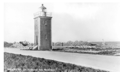
De vuurtoren begin jaren 1960.