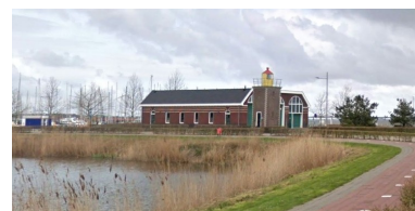
Google Streetview: Het Maritiem Verenigingsgebouw en daarvoor de vuurtoren.