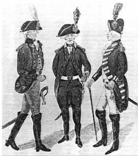
Links: Officier van de rijdende artillerie Midden: Officier Korps Jagers "Van Heijde" Rechts: Officier Korps van "De Lega" (niet present in de Westhoek)

Bataljon Gardewalen "Van Perez" Bataljon Jagers "Van Bylandt" Korps "Van Damas" (6 compagnieën Franse uitgewekenen, lichte infanterie) Korps "Van Béon" (3 compagnieën Franse uitgewekenen, lichte infanterie) 3 compagnieën van het Korps Jagers "Van Matthieu" (later "Van Heijde") 2 eskadrons van het Regiment Dragonders "Hessen-Cassel" 1 eskadron van het Regiment Dragonders "Van Bylandt" detachement rijdende artillerie.