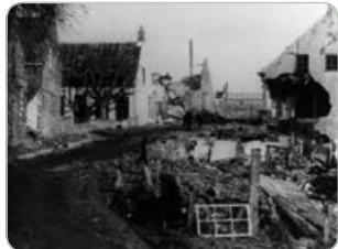
Oorlogsschade in Moerdijk