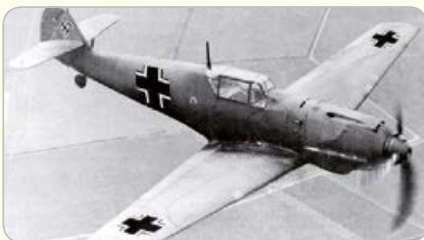
← Messerschmitt Bf109

U bevindt zich op de Achterdijk. Vanaf knooppunt 38 volgt u de route naar knooppunt 40 en vervolgens naar knooppunt 57 . U fietst nu op de Hoge Zeedijk.