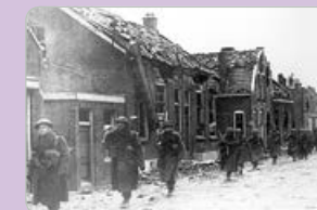
→ Poolse bevrijders in Moerdijk

In de herfst van 1944 kwam Moerdijk (weer) in de frontlinie te liggen. De Poolse 1e Pantserdivisie heeft om vrijwel elk gebouw hevige strijd moeten leveren. Op 9 november werden de Duitsers over de Moerdijkbruggen naar het noorden gejaagd.