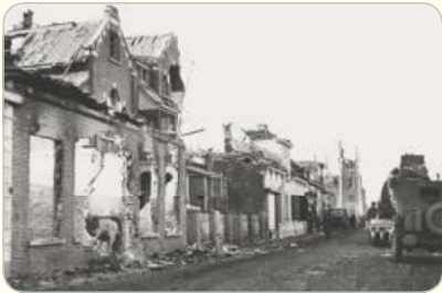
← Havenstraat Standaardbuiten

Het dorp Standaardbuiten heeft veel schade opgelopen bij de bevrijding in november 1944.