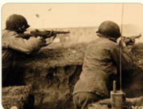
← Timberwolf militairen bij de Schans

Over de brug is het buurtschap de Schans. Tot hier kwamen de militairen van het 415e Amerikaanse regiment van de Timberwolf-divisie. Toen was er alleen een open vlakte van onbegroeide akkers. De dijkhuizen boden een redelijke beschutting, omdat ze deels in de dijk zijn gebouwd. Na het opblazen van de brug over the Mark tussen Standdaarbuiten en de Schans, begonnen de Amerikanen met het zuiveren van dit gebied ten zuiden van de Mark.